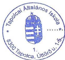
Bajner Imre igazgató